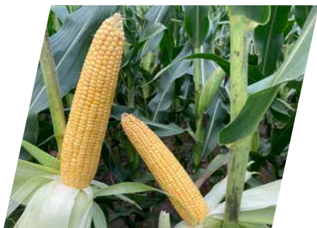
/// DKC4933, Vashosszúfalu, 2023

...akik a FAO400-as éréscsoport legütőképesebb új hibridjét keresik. Óriási terméspotenciál, gyors vízleadás és rendkívüli aszály- és stressztűrő képesség.