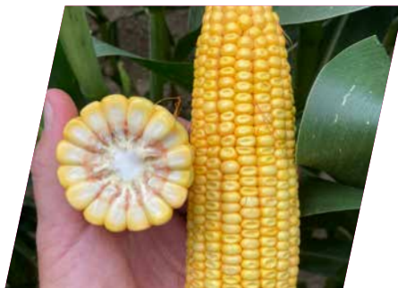
/// DKC4933, Kerta, 2023