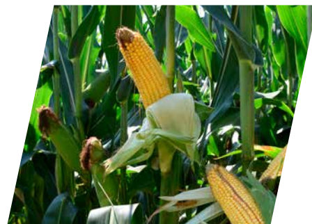
/// DKC4933, Pölöskefő, 2023