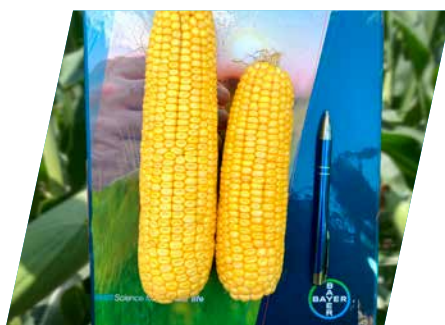
/// DKC5810 vs DKC5830, Sárvár, 2022