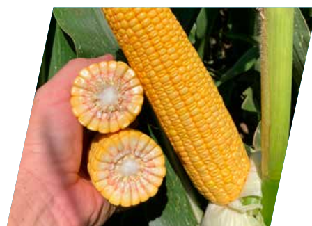
/// DKC5810, Sárvár, 2022