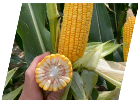
/// DKC5810, Murakeresztúr, 2023

...akik egy kései virágzási- és érésidőjű stabil hibridet keresnek, mely alacsony tőszámra, akár aszályos évjáratban is kiváló terméshozamra képes. A DKC5810 kiváló aszály- és stressztűrő képességgel rendelkező hibrid, mely kötelező hibridje azon termelőknek, akik az elhúzódó aratási szezon végén szeretnék rekordtermést elérni.